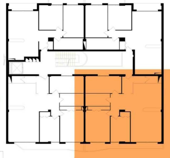
PLAN DETACHE COURANT